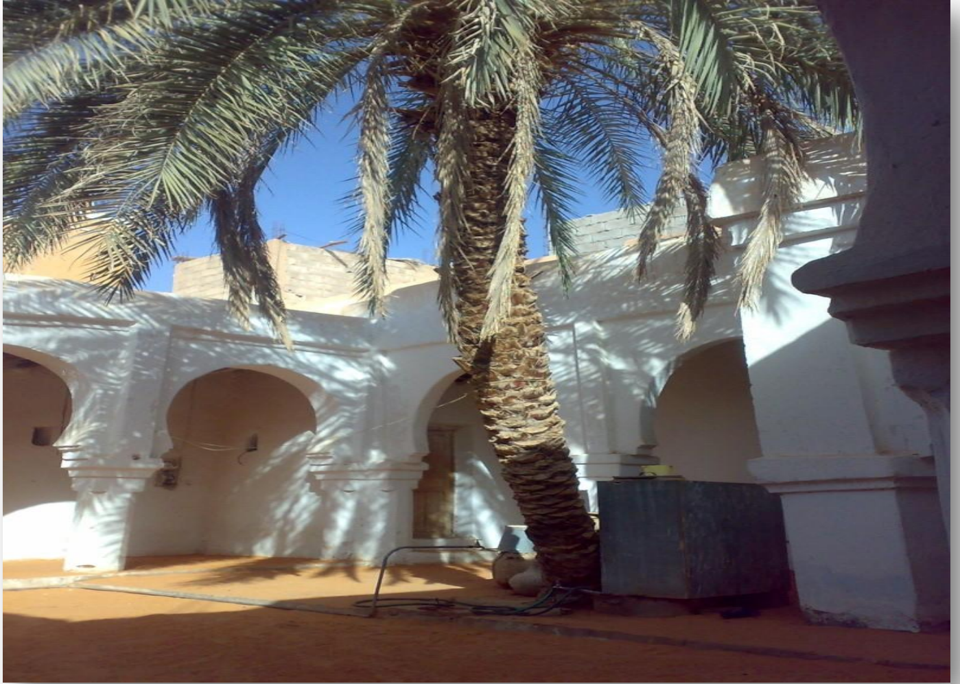
قصر سيدي احمد بن علي